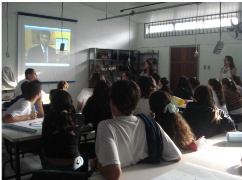
Estudantes assistindo a um vídeo sobre Aborto na oficina de Violência

werPoint que mostrava as várias formas de violência e três vídeos com o objetivo de atrair a atenção dos alunos.