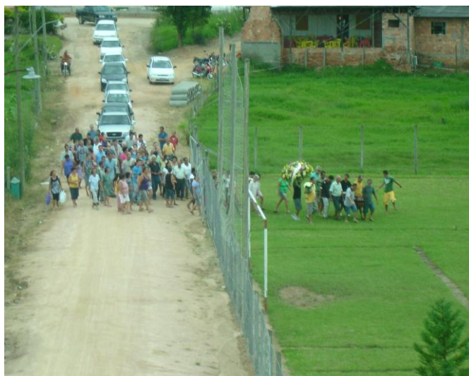
Fotos 12 – Enterro de Ícaro no momento que passa pelo campo de futebol