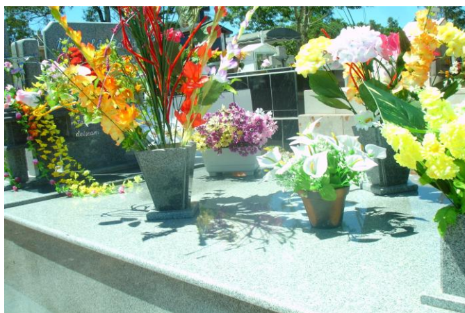
Foto 10- Cemitério católico de São Tomaz no dia de finados em 2009- detalhe das flores artificiais