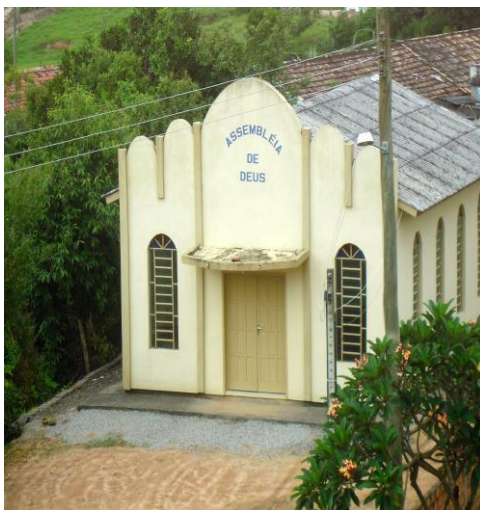
Foto 02-Assembleia de Deus do sul