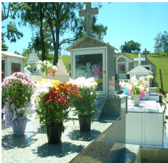
Foto 09 -Cemitério católico de São Tomaz no dia de finados em 2009 – detalhe das flores naturais