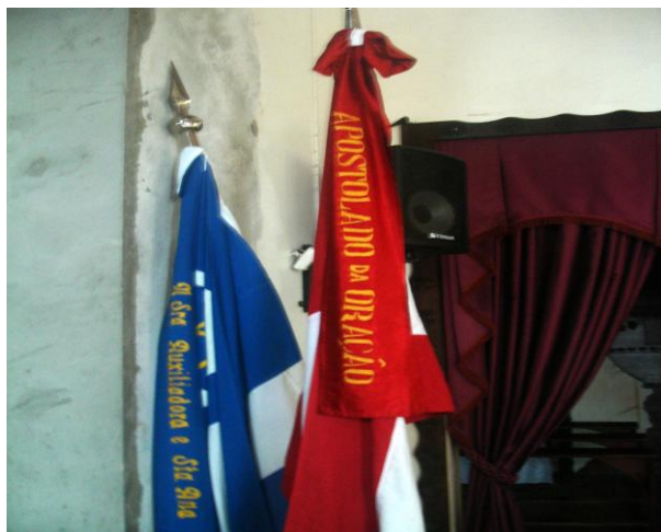
Foto 11 – Bandeiras da Congregação Mariana (Azul) e do Apostolado da Oração (vermelha)