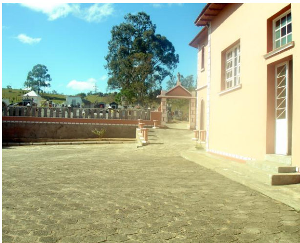
Foto 05 - Entrada principal do cemitério católico