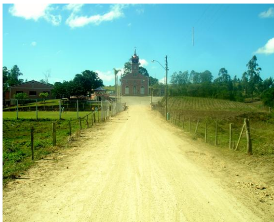
Foto 04 -Igreja Católica de São Tomaz. A esquerda está o campo de futebol e mais acima o salão de bailes