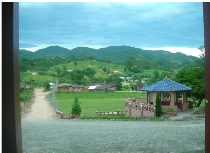
Foto 07 -vista do centro do bairro, à direita o coreto e abaixo o campo de futebol