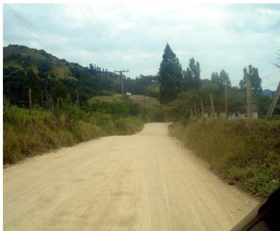
Foto 08 – vista fora do centro do bairro onde podemos ver a distância entre as casas