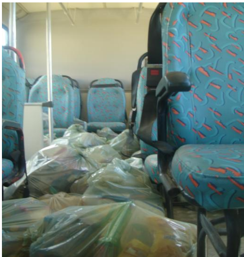
Foto 01 -Transporte de alimentos feito no ônibus de linha